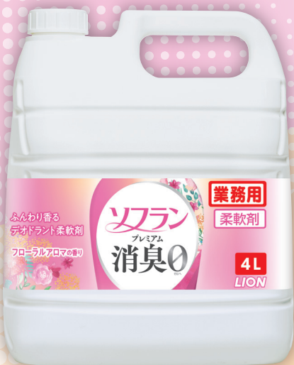
フローラルアロマの香り / 4L