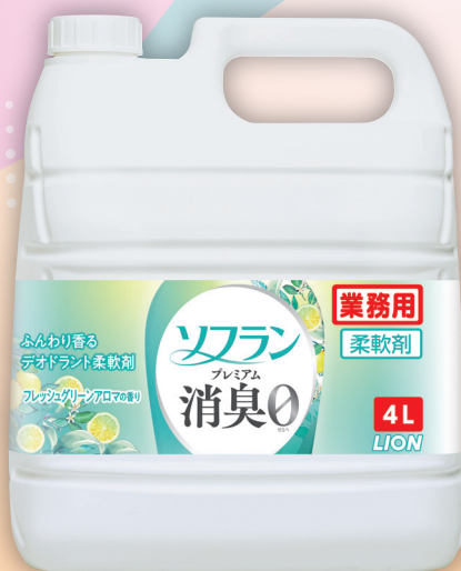
フレッシュグリーンアロマの香り / 4L