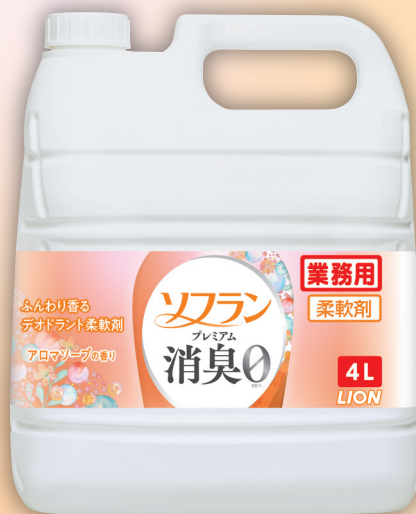
アロマソープの香り / 4L